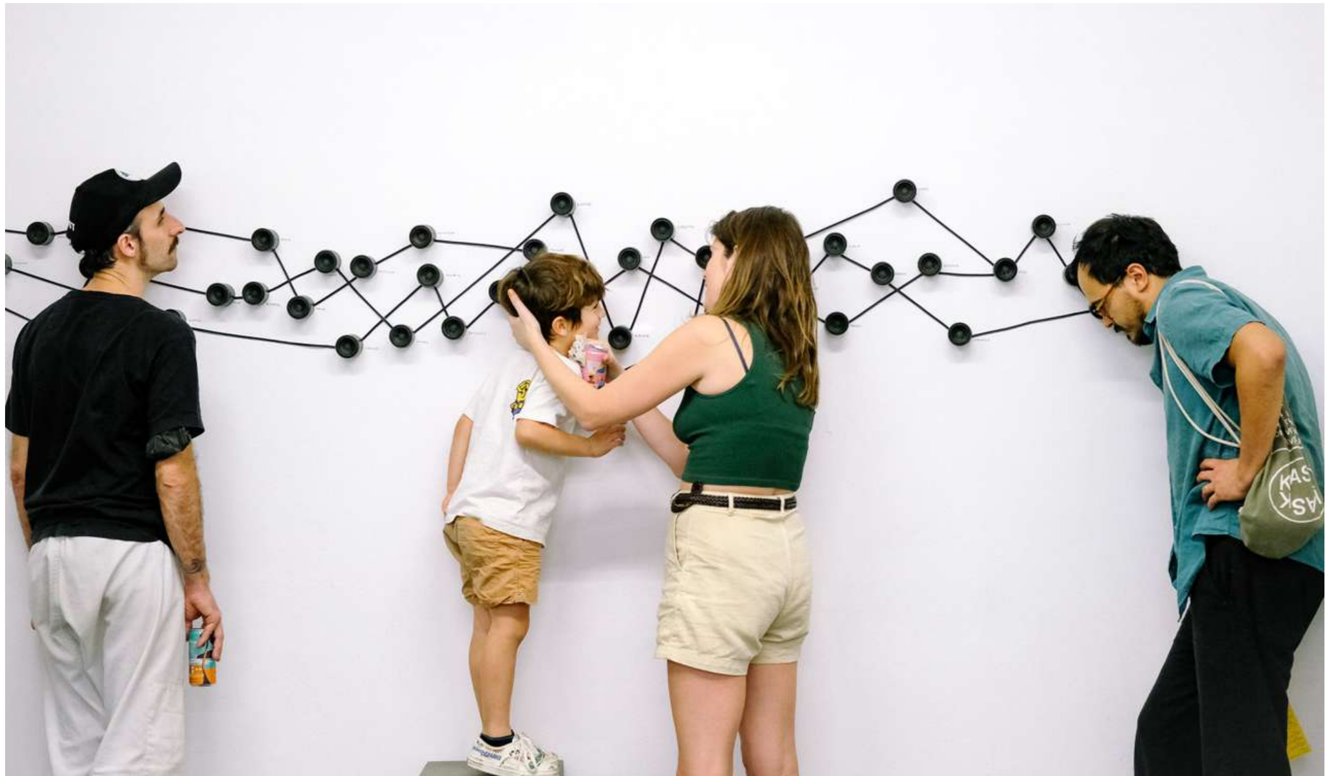
Ao Pé do Ouvido (À l'Oreille) | Installation Sonore | En collaboration avec des migrants | Brésil | 2022 Une invitation à écouter les voix des personnes venues vivre à São Paulo : migrants ou réfugiés, étrangers ou Brésiliens. Chaque participant(e) partage les rêves de vie qui l'ont motivé à venir dans un haut-parleur disposé sur le mur à la hauteur de son oreille. Les langues s'entremêlent, révèlent leurs sonorités et nous content, en chœur, les rêves collectifs de São Paulo. felixblume.com/aopedoouvido